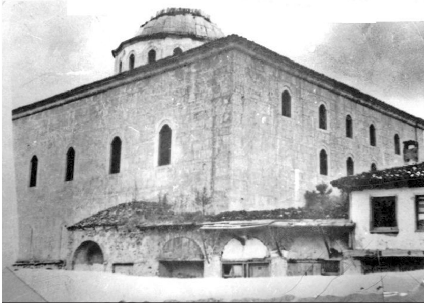
Kıranköy Ayios Stefanos Kilisesi

nen yapıların, belgelerin yazıldığı 1847 yılında inşa edilip edilmediği bilinmemektedir. Dolayısıyla günümüze kalan İskalion Mektebi ile Metropolitlik binasının, öncesinde başka binalarda varlık gösterip göstermediği soruları şimdilik cevapsızdır. Belgeler sadece talep ve izin istekleri ile resmi görevlilerin cemaatin ileri gelenleriyle birlikte yaptığı keşif sonuçlarına ilişkin verileri içermektedir. Ancak, bununla birlikte hem kiliseye hem de çevresine ilişkin önemli bilgiler vermektedir.