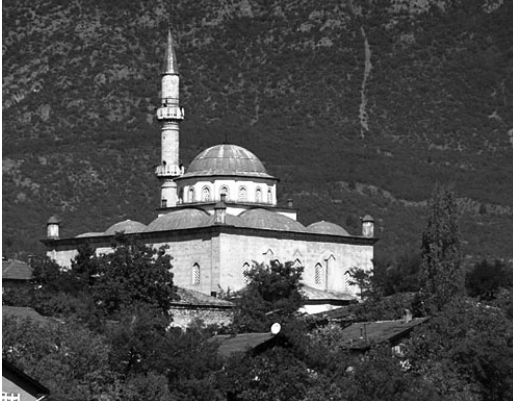
Kıranköy Ulu Cami'nin (eski Ayios Stefanos Kilisesi), bugünkü durumu.

çan takılmamasını, Rum cemaatinin “saygısı”yla ilişkilendirmiştir. 22 “Saygı” kavramı dışında açıklanabilecek olan bu durum, kuşkusuz devletin konuya ilişkin sınırlamaları ile ilişkilidir. Osmanlı yönetimi pek çok dönemde çeşitli cemaatlerin kiliselerindeki çan kulelerinin sayısını, çan çalmayı ve hatta kilise avlularında tahta vurmaya yasaklamış veya sınırlandırmıştır. 19. yüzyılda da bu yasakların -görece- esnekliklerle devamlılık gösterdiğini söylemek gerekir. 23