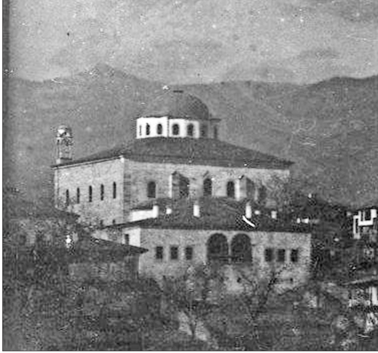
Kıranköy Ayios Stefanos Kilisesi ( http://terscita.blogspot.com.tr/2012/12/krankoy , Erişim: 29.01.2016)

sesi örneği olduğu ve İstanbul'daki kiliselerle karşılaştırılmayacak yerel bir mimari çözüm içerdiği söylenebilir.